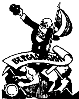
Карикатура на Пуанкаре — одновременно шарж на Ленина (либо Пуанкаре дан как «анти-Ленин»)

Этот безудержный протеизм, непринужденное скольжение по контрастным оценкам единого мотива, вечное двойничество положительных и отрицательных персонажей вносит существенные коррективы в вопрос о т.н. искренности Маяковского. В его брани всегда прячется панегирик, а в панегирике — готовность оплевать сегодняшнего кумира. В качестве прямой иллюстрации приведу две карикатуры из «агитлубков» 1923 года.