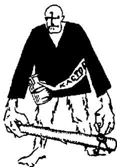
Гориллоподобный Муссолини — шаржированный автопортрет Маяковского-футуриста

Да и трудно тут всерьез говорить об искренности Маяковского, несмотря на его бесспорное психологическое родство с большевизмом 78 как самым brutальным порождением религиозно-утопического материализма. Уж слыш-